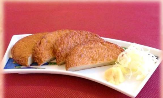
さつま揚げ 580円 (税込 638円)