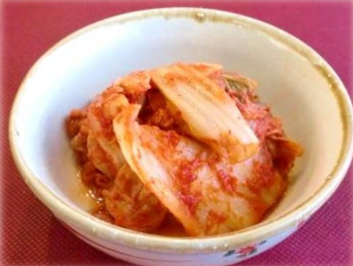
キムチ 480円 (税込 528円)