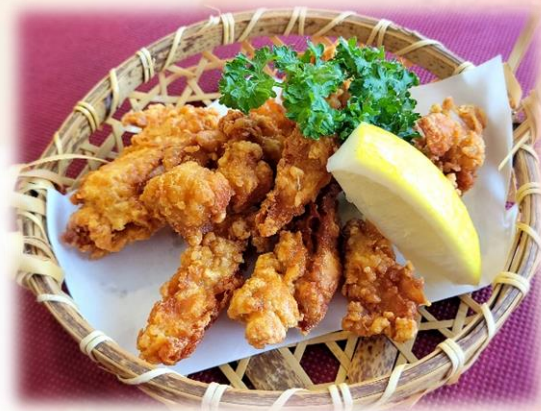
鶏軟骨の唐揚げ 680円 (税込 748円)