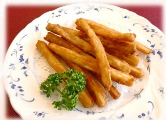
ごぼうスティック 680円 (税込 748円)