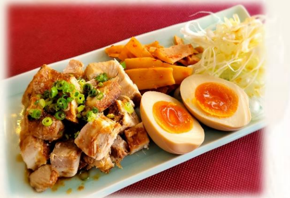
とりあえず3種盛り 880円 (税込 968円)