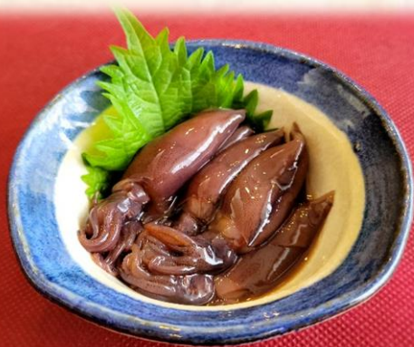
ホタルイカの沖漬け 680円 (税込 748円)