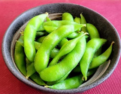
枝豆 480円 (税込 528円)