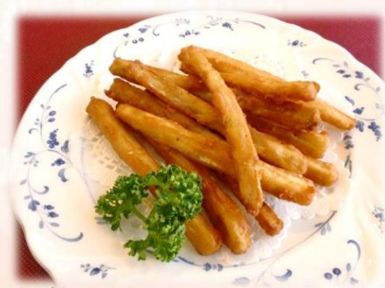
ごぼうスティック 680円 (税込 748円)