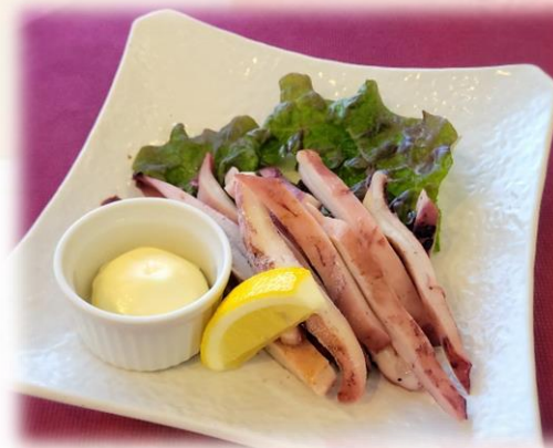
焼きいか 730円 (税込 803円)