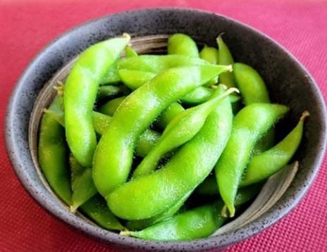
枝豆 480円 (税込 528円)